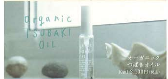
オーガニック つばきオイル 10ml 2,100円(税込)

point. 化粧水でしっかり水分を補給した後、化粧水にオーガニックつばきオイルを数滴混ぜて使用すると、さっぱりとした仕上がりに。