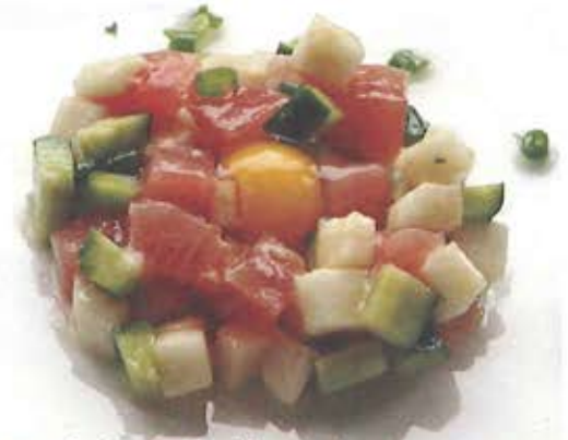
まぐろと長いもの ユッケ風